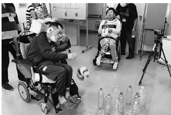
スポーツレクリエーション